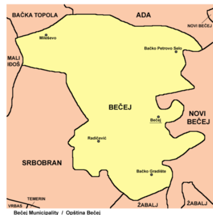
Слика 2. Картографски приказ Општине

Насељу Бечеј катастарски припадају „Пољанице”, које се налазе на око 15км северозападно од насеља Бечеј, док насељу Милешево припада „Дрљан” који се налази одмах поред.